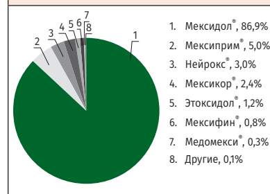
РИСУНОК 2 Долевое соотношение объемов продаж препаратов этилметилгидроксипиридина сукцината по итогам 2018 г., %руб.

нию больных с ишемическим инсультом и транзиторными ишемическими атаками. Он включен в укладку скорой медицинской помощи и в 38 важнейших стандартов оказания медицинской помощи, в т. ч. в Стандарт оказания специализированной медицинской помощи при инфаркте мозга [7, 8].